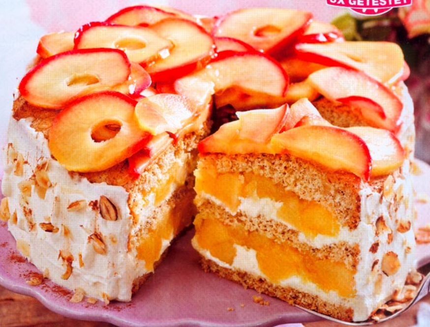
Apfel-Nusstorte mit Eierlikörcreme S. 60

ALLE REZEPTE von der Redaktion 3X GETESTET